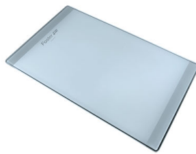
Tagliere in cristallo 8631 300