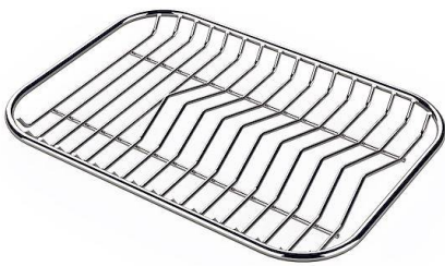
Griglia portapiatti inox 8100 154