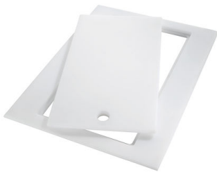
Tagliere Twin in HDPE 8644 101