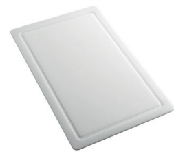
Tagliere in HPDE 8657 001