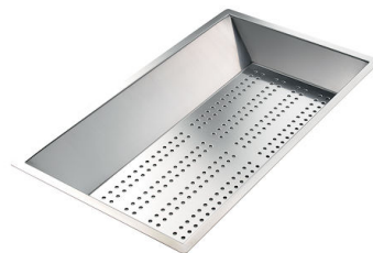
Vaschetta forata inox 8151 000 * solo in abbinamento con l'accessorio 8644 101